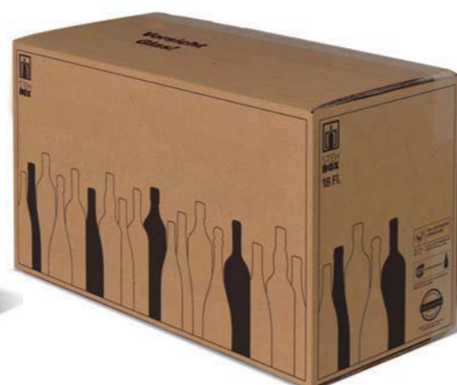
18er STEHBOX® mit PREMIUM Einlage

Artikelnummer: PREMI 1500 Prüfnummer: 601/07 Verpackungseinheit: 15 Stück Mindestabnahmemenge: 30 Stück