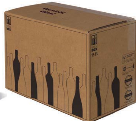
15er STEHBOX® mit PREMIUM Einlage

Artikelnummer: PREMI 1200 Prüfnummer: 601/07 Verpackungseinheit: 15 Stück Mindestabnahmemenge: 15 Stück