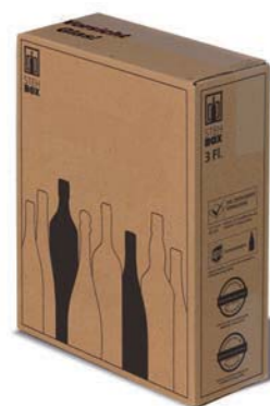
3er STEHBOX® mit PREMIUM Einlage

Artikelnummer: PREMI 300 Prüfnummer: 601/07 Verpackungseinheit: 15 Stück Mindestabnahmemenge: 30 Stück