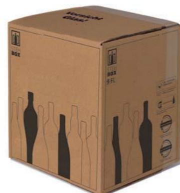
9er STEHBOX® mit PREMIUM Einlage

Artikelnummer: PREMI 600 Prüfnummer: 601/07 Verpackungseinheit: 15 Stück Mindestabnahmemenge: 15 Stück