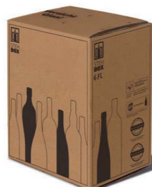
6er STEHBOX® mit PREMIUM Einlage

Artikelnummer: PREMI 300 Prüfnummer: 601/07 Verpackungseinheit: 15 Stück Mindestabnahmemenge: 30 Stück