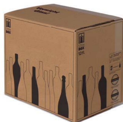
12er STEHBOX® mit PREMIUM Einlage

Artikelnummer: PREMI 900 Prüfnummer: 601/07 Verpackungseinheit: 15 Stück Mindestabnahmemenge: 15 Stück